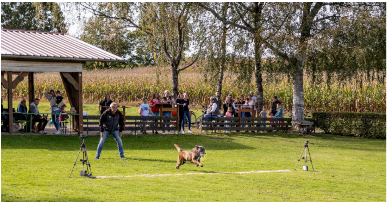
Zwei Sensorstationen messen die Geschwindigkeit beim Hunderennen

Weitere Veranstaltungen des Vereines werden rechtzeitig auf der Homepage des Vereines bekanntgegeben. Und wer Interesse hat sich mit seinem Hund in das Vereinsleben einzubringen, darf gerne zu den Trainingszeiten auf dem Hundesportplatz „Am Erlengraben“ in Sexau vorbeischaun. Das Training findet immer dienstags und freitags ab 18:00 Uhr statt.