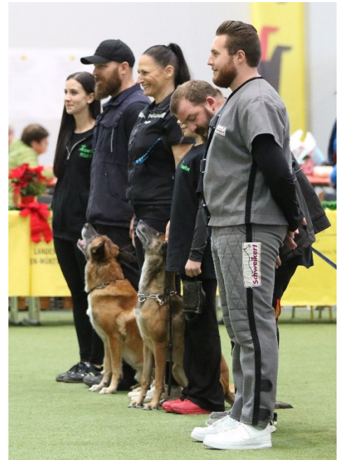
Messe swhv Team IGP

Unsere Vorführungen wurden von den Zuschauern mit großem Interesse verfolgt und mehrfach wurde die Offenheit, die Arbeitsfreude und die positive Ausstrahlung unserer Hunde bewundert.