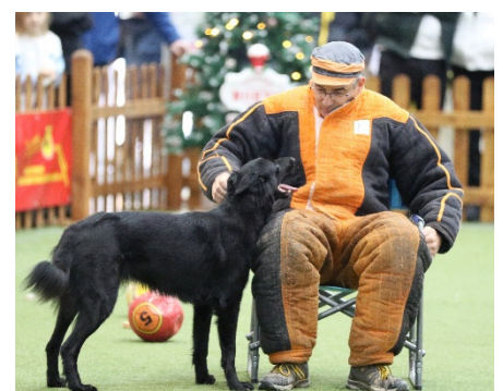
Messe swhv Team Mondioring