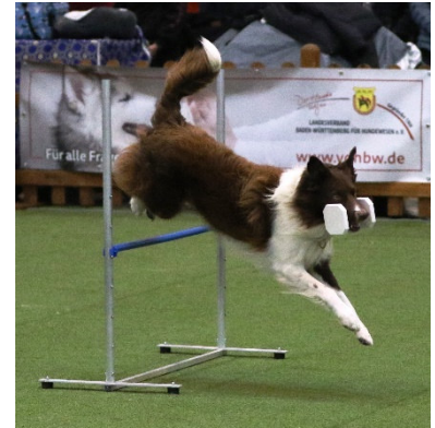
Messe swhv Team Obedience