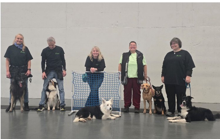
Messe swhv Team Hoopers